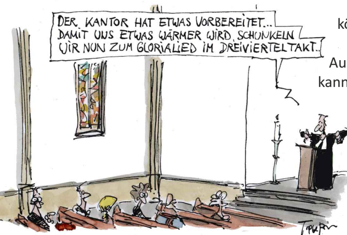
DER WINTER KOMMT... ENERGIESPARBEWEGUNG

Alle Gottesdienstangebote können auf diesem Weg aufrechterhalten werden, und das ist doch die Hauptsache.